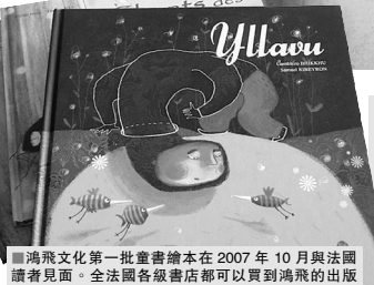
鴻飛文化第一批童書繪本在2007年10月與法國讀者見面。全法國各級書店都可以買到鴻飛的出版品，比利時與盧森堡的讀者也即將享有相同的服務。