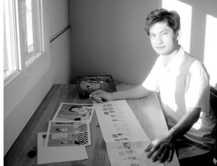
鴻飛文化的工作室位於巴黎東郊。艾菲爾鐵塔的背景與馬恩河谷翠綠的景色提供一個適合思考與發掘靈感的工作環境，使每一本書的構思、製作與發行過程更為精緻、順暢。